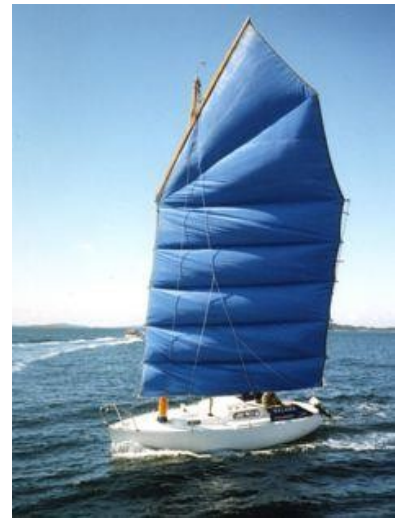
1999, with taller mast and 7 panels.

Quelques photos de Malena et de ses voiles de jonques. Je l'ai eue de 1981 à 1999. Ses nouveaux propriétaires continuent à me parler !