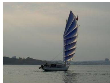
Johanna, mon bateau depuis 1998, montrant ses panneaux cambrés