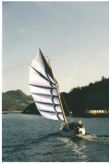
1994, new sail with cambered panels